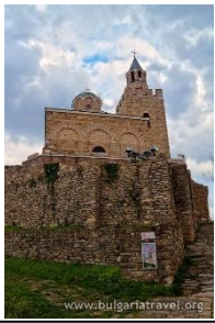
Veliko Tarnovo, Festung Tsarevets

Tag 2 - 21 März - Donnerstag - Nach dem Frühstück, Fahrt nach Veliko Tarnovo (250km von Sofia entfernt). Die Fahrt dauert zirka 3 Stunden.