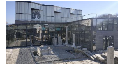
Plovdiv, Die Große Basilika