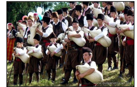
Dudelsack-Festival in den Rhodopen

20. Mai, Sonntag – Nach dem Frühstück, freie Zeit in Sofia. Transfer zum Flughafen und Flug nach Wien.